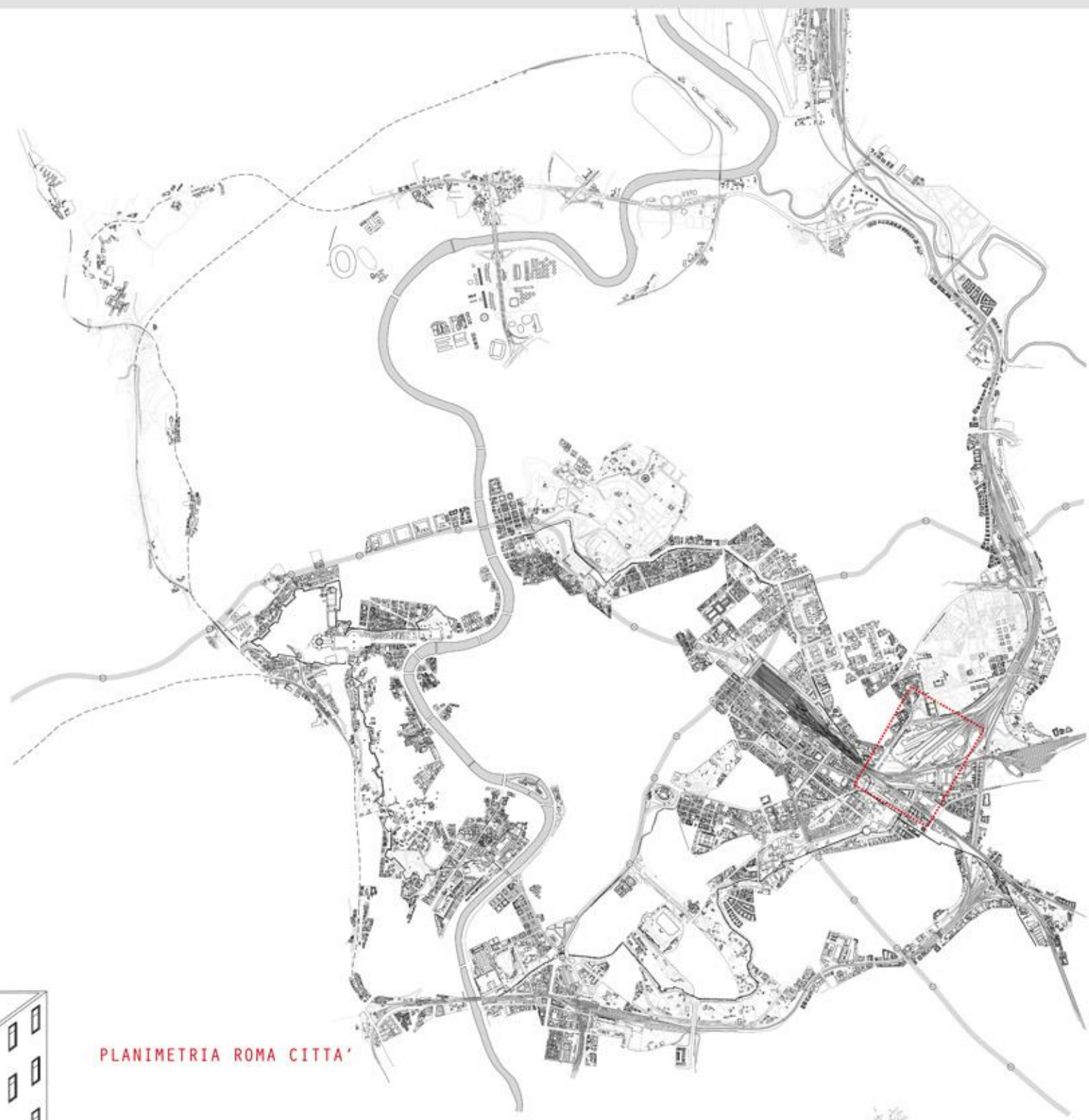
PLANIMETRIA ROMA CITTA'

Il recente dibattito sulla sopraelevata di San Lorenzo e quindi della tangenziale est di Roma, unita all'accesa contrapposizione tipicamente "italiana" tra chi vorrebbe demolirla e chi vorrebbe conservarla ha fatto sì che il mio progetto di tesi non si schieri né da una parte né dall'altra ma è in grado di guardare la città di Roma fatta come insieme di città stratificate: città storica, città moderna, città contemporanea. La sopraelevata vede la luce a fine anni 60 tra la zona di San Giovanni e il parco del Verano, realizzata dalla Finmeccanica su progetto del Prof. ing. Fabrizio De Miranda da molti considerati un "guru" di opere infrastrutturali. L'opera di sicuro interesse sul piano realizzativo e tecnologico si palesa più, nella sua scultorea plasticità capace di garantire prospettive inaspettate ed inedite, capace di snodarsi dinamicamente nel tessuto urbano. Queste percezioni privilegiate rispetto a chi "abita" all'ombra della tangenziale, sono state le linee guida del mio progetto.