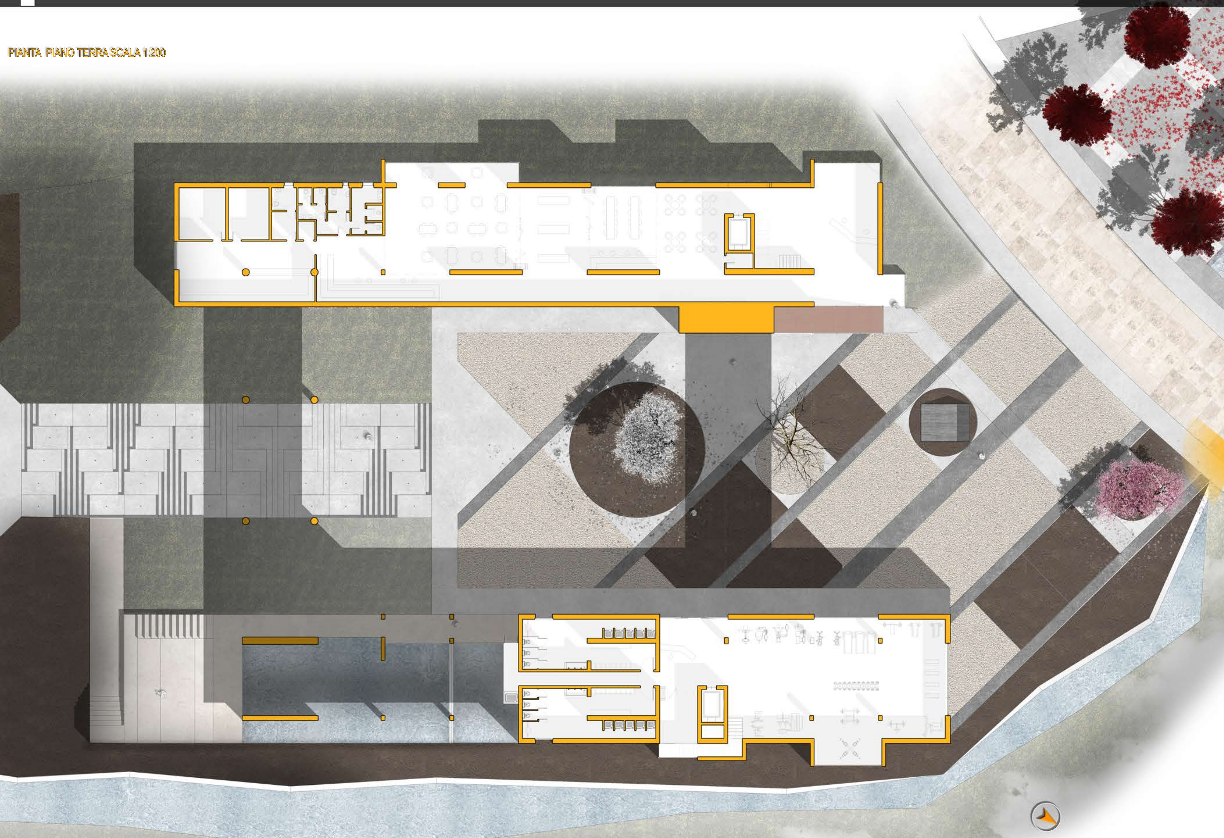
PIANTA PIANO TERRA SCALA 1:200